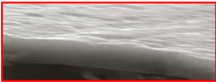
Abb. 1 Hartstoff der II. Generation HSS5600/100R, 1,2µm – abgeschieden mittels 3D HAUC-CVD-Verfahren.

Dank der Oberflächenveredelung von Räumwerkzeugen mittels dem Nano-Hartstoffsystem H-SS5600/100R ist es gelungen ihre Standzeit, im Vergleich mit TiCN(PVD) beschichteten, von dem Faktor 2,7 auf Faktor 10,8 zu erhöhen, (s. Abb. 1 u. Diagramm 1). Den Auslöser für so eine hohe Standzeitsteigerung ist vor allem in den Eigenschaften